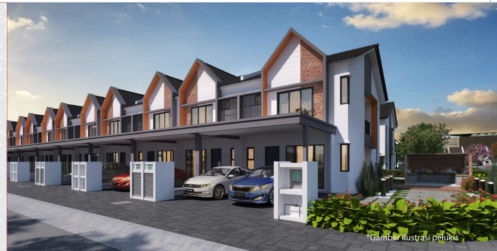
*Gambar ilustrasi pelukis