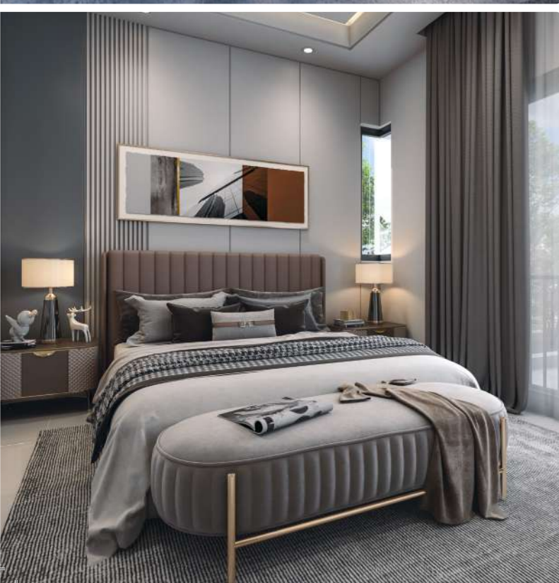
*Gambar ilustrasi pelukis