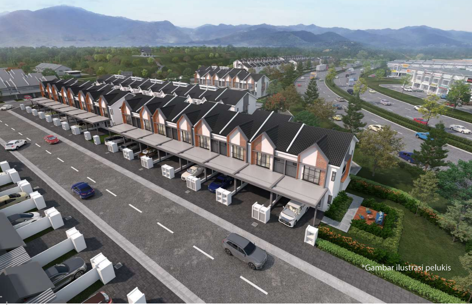
*Gambar ilustrasi pelukis